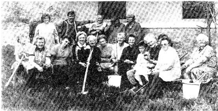
Nach guter Arbeit — eine gemeinsame Aufnahme... Mit Hilfe aus der BRD wurde auch in Käsmark/Kežmarok ein Haus angekauft, das als Begegnungsstätte der Oberzipser dienen wird. Die Mitglieder der OG in Käsmark stellten sich bereit, bei den Arbeiten mitzuhelfen.