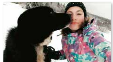
Ein Spaziergang mit dem besten Freund, den man haben kann.