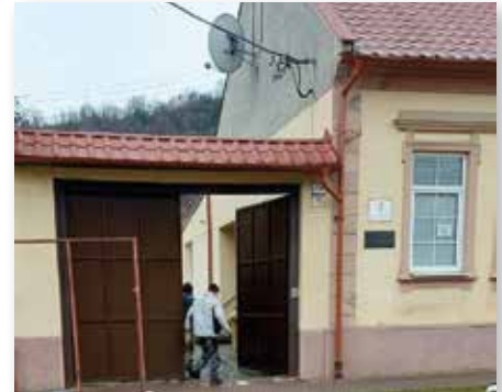
Ein neues Tor für das Haus der Begegnung in Metzenseifen/Medzev

Die Unterstützung durch das Bundesministerium des Innern bedeutet für uns nicht nur eine finanzielle Hilfe, sondern auch ein starkes Zeichen des Vertrauens, der Anerkennung und der Partnerschaft. Sie ermöglicht es uns, das kulturelle Erbe der Karpatendeutschen zu