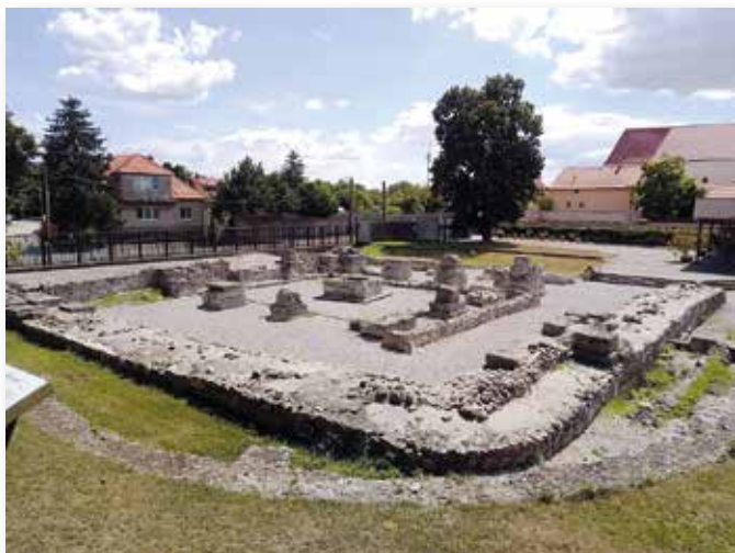
Das Museum „Gerulata“ im Pressburger Stadtteil Karlbud/Rusovce