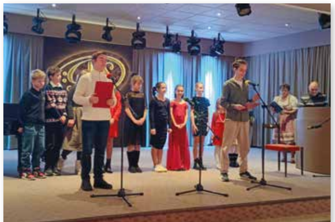
Ein paar Eindrücke von unserem Auftritt beim Jahresabschlusskonzert in Kaschau