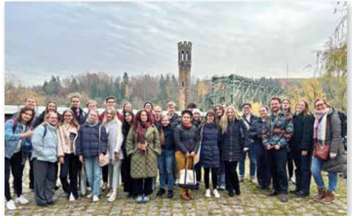
Gruppenfoto der Teilnehmer vor der Kaiserin-Elisabeth-Brücke in Passau.