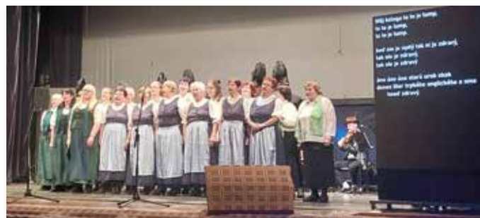
Die Karpatendeutschen bei ihrem Auftritt