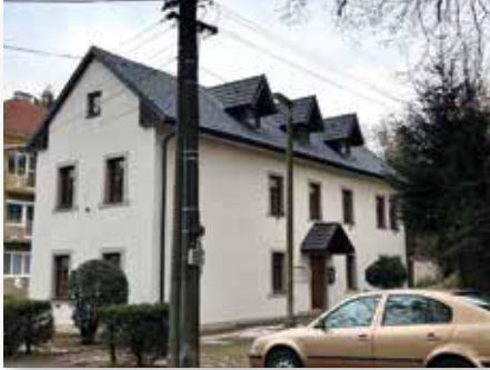
Neues Dach für das Haus der Begegnung in Krickerhau/Handlová

Dank dieser Unterstützung ist es uns möglich, das kulturelle, sprachliche und gesellschaftliche Leben unserer Mitglieder in allen