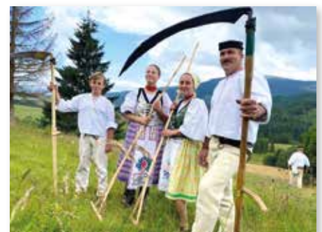
Ein Familienbild, das mehr erzählt als tausend Worte.

Die Jugend liebt heutzutage den Luxus, hat schlechte Manieren und verachtet die Autorität“, soll Sokrates einst gesagt haben. Heute klingen Sätze wie dieser in den Ohren der Jugendlichen ungefähr so: „Die hängen doch nur noch an ihren Bildschirmen! Die wissen doch gar nicht mehr, was Arbeit ist! Die tanzen lieber für Likes, als was Sinnvolles zu tun!“ Aber vielleicht ist das nur die halbe Wahrheit. In unserer Interview-Serie „Unerhört?“ wollen wir zuhören, hinter die Screens schauen, hinter die Augenringe, hinter die Stories, die oft nur die halbe Wahrheit zeigen. Wir wollen wissen, was bleibt, wenn man den Filter wegnimmt.