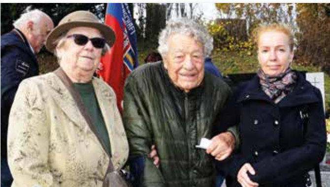
Bei unserem Gedenkausflug nach Hainburg