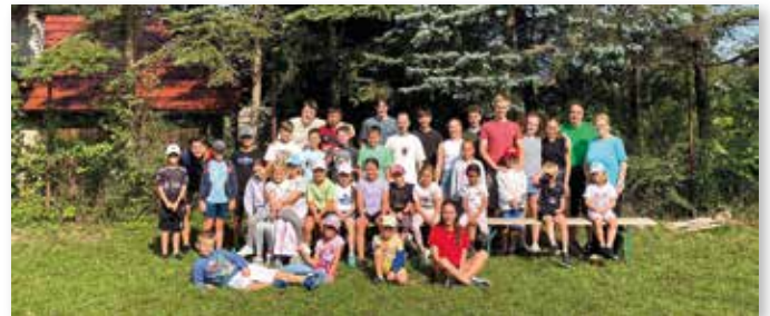
Sommersprachcamp in Metzenseifen