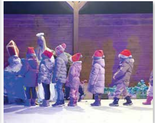
Als der Nikolaus kam, leuchteten die Augen der Kinder.