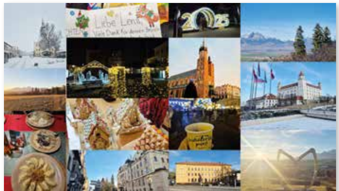
Collage mit fotografischen Erinnerungen an die acht Wochen in Kesmark