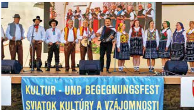
Kultur- und Begegnungsfest 2025