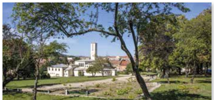
Kulturausflug nach Ödenburg/Sopron