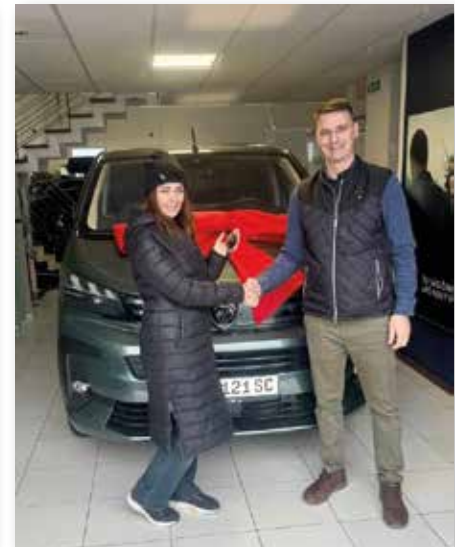
Ein neuer Transporter für den KDV