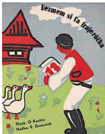
Genersichs Foxtrott dient fast 70 Jahre später als Filmmusik