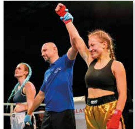
Nicht alle Helden tragen Umhänge. Manche tragen goldene Shorts.

Mich haben schon immer härtere Sportarten interessiert. Vorher habe ich jahrelang Gymnastik gemacht und Kickboxen kam dann irgendwie zufällig. Ich wollte vielleicht auch beweisen, dass ich tougher bin als viele Männer. (lacht) Ich mag das Gefühl, mich selbst zu überwinden. Wenn man im Kampf am Limit ist, muss man irgendwoher noch Kraft holen. Das brauche ich wohl in allem, was ich mache. Im Januar waren es drei Jahre, seit ich angefangen habe.