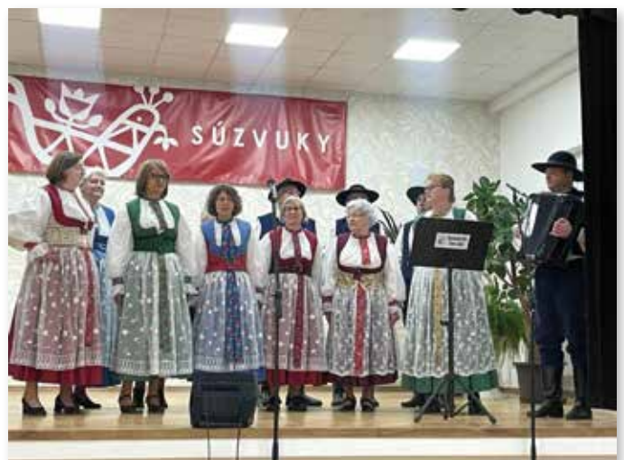
Die Neutrataler auf dem „Súzvuky“-Fest