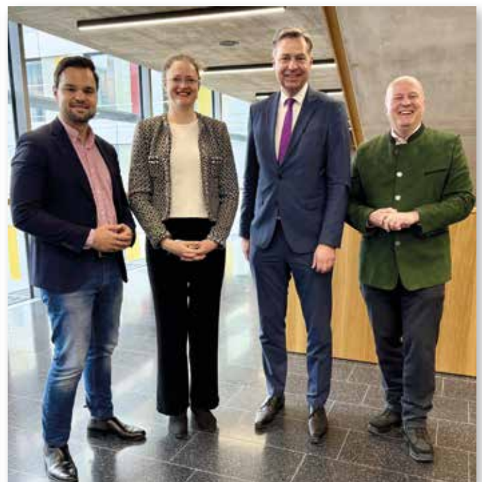
...dem Bundestagsabgeordneten Stephan Mayer.