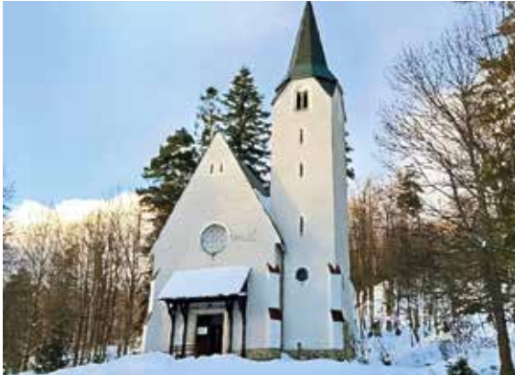
Die evangelische Kirche in Tatralomnitz/Tatranská Lomnica