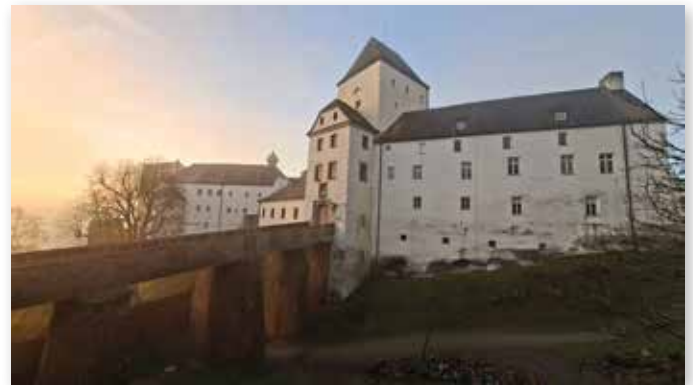
Die berühmte Veste Oberhaus