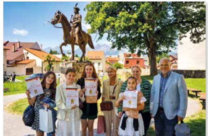
Wettbewerb im Vortragen von Poesie und Prosa in deutscher Sprache