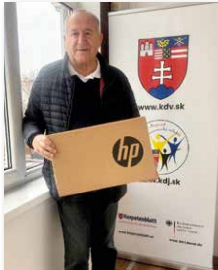
Notebook für die Ortsgruppe Obermetzenseifen