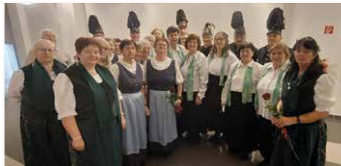
Die karpatendeutschen Gruppen auf der Faschingsfeier