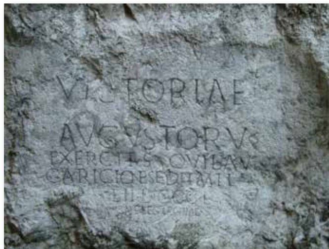
Die Inschrift auf dem Burgfelsen von Trentschin/Trenčín