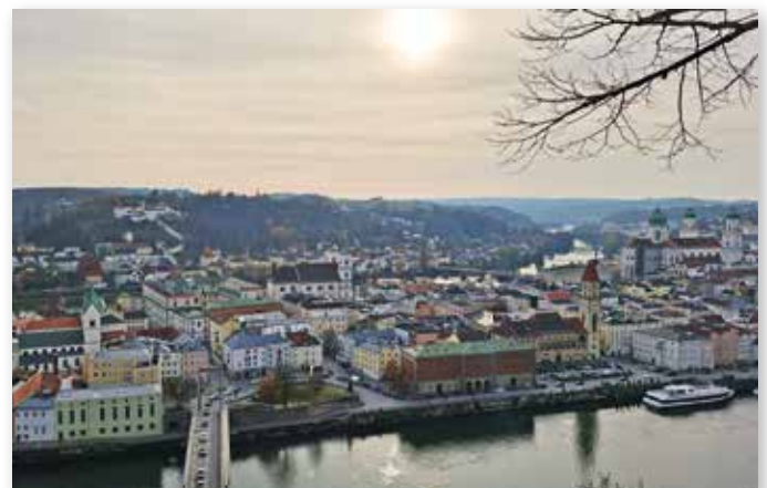
Traumhafter Ausblick auf die Dreiflüssestadt