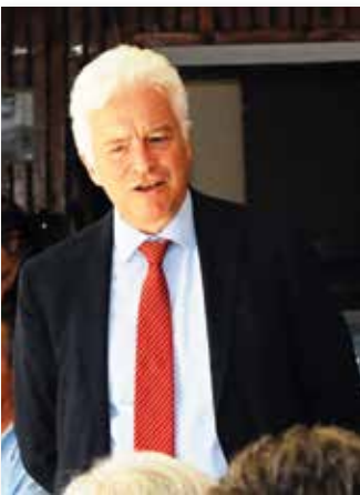
Der deutsche Botschafter zu Gast im Haus der Begegnung