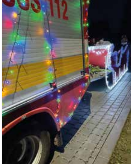
Der Nikolaus kam mit einem außergewöhnlichen Schlitten angereist.