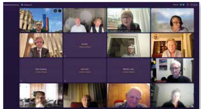
Die Bildschirmkopie des virtuellen Treffens zum 5. Karpatendeutschen Forum zeigt einen Teil der Anwesenden.

In den Beiträgen kam auch zum Ausdruck, dass dazu neben dem stärkeren