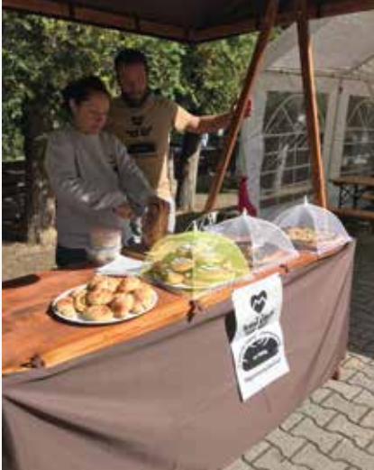
Süße Leckereien auf dem Weihnachtsmarkt in Schmiedshau