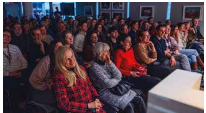
Bei der Aufführung im Österreichischen Kulturforum blieb kein Auge trocken.