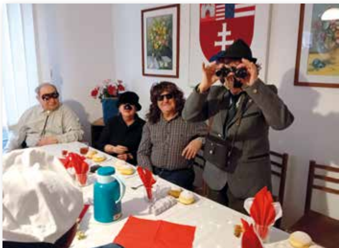
Humorvolle Kostüme und kleine Szenen bereicherten das Faschingsprogramm.