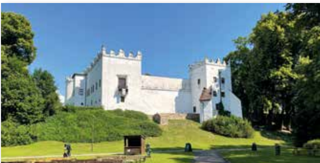
Ansicht des Schlosses Nehre/Strážky vom Park