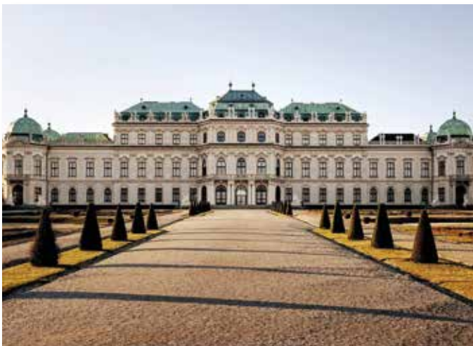
Das Obere Belvedere