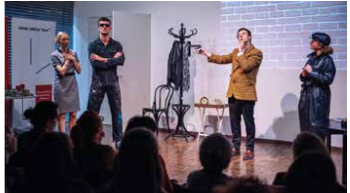
Die studentische Theatergruppe inszenierte das Wiener Kabarett „Lachen ist simpl“.

Nach dem Semester spürt er klare Fortschritte. Er lernte vor allem die Unterschiede zwischen dem Deutschen und dem Österreichischen kennen, was auch im Stück zu hören war. Das Kabarett basiert auf Sketchen