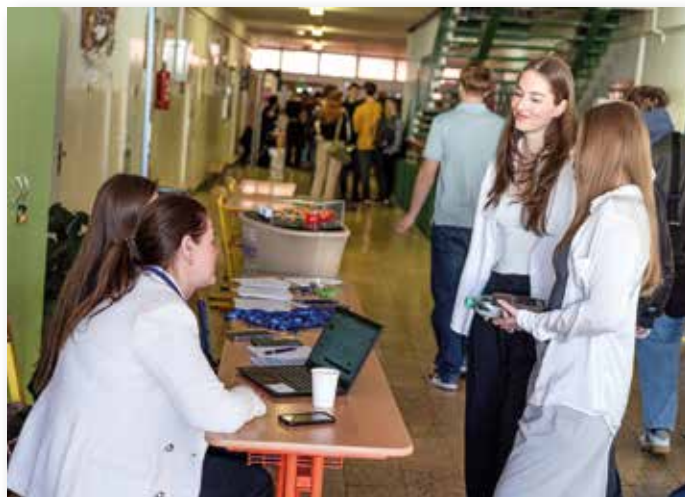
Im vergangenen Jahr fand die Studien- und Berufsmesse zum ersten Mal statt.