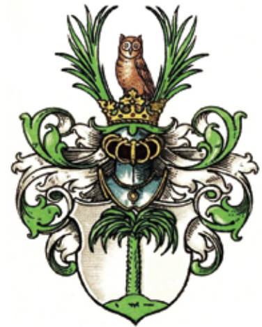
Das Stammwappen der Palms ziert eine Palme

Doch wie so oft in der Geschichte brachten Kriege und wirtschaftliche Unsicherheiten Veränderungen. Der Österreichische Erbfolgekrieg störte