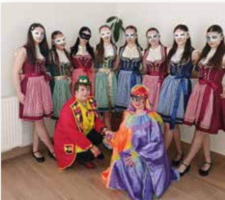
Auch die Mitglieder der ältesten Mädhentanzgruppe waren dabei.