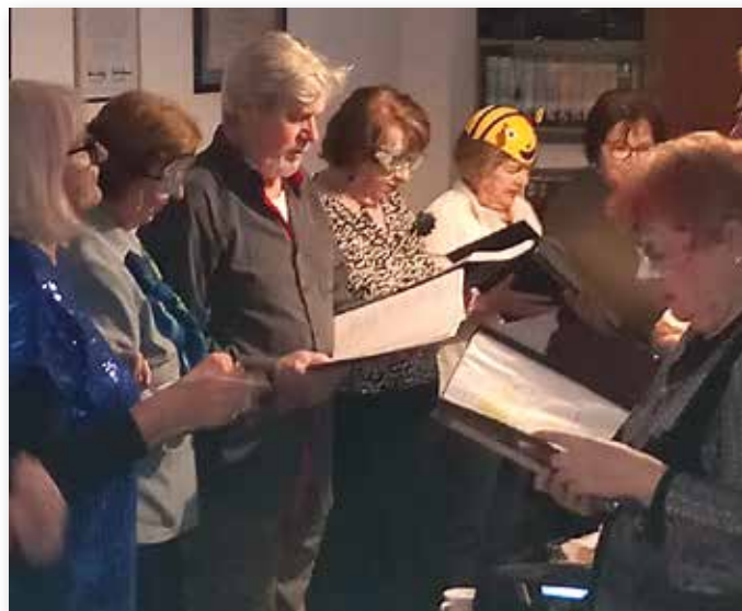
Die Sängerguppe „Nachtigall“ sorgte mit ihren Liedern für beste Stimmung.