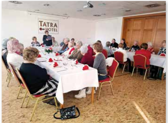
Wir besprachen den Jahresbericht und unsere Kassenwartin informierte über die Finanzen.