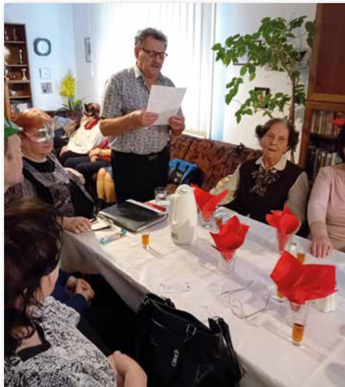
Herr Kollár referierte über die Bedeutung der Faschingszeit.