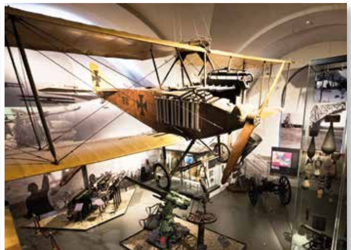
Das Museum beherbergt historische Schätze.