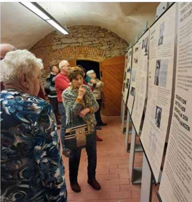
Mitglieder der Ortsgemeinschaft Schmöllnitz Hütte beim Besuch der Ausstellung im Zipser Museum.

Die Ausstellung führt die Besucher schrittweise in die Geschichte der Karpatendeutschen vom Mittelalter bis zum Ende des Zweiten Weltkrieges ein. Dadurch wird ein breiterer Kontext für die Ereignisse