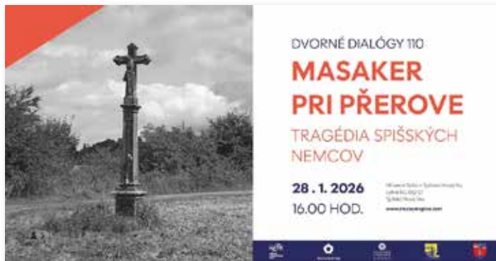
Die Einladung zu der Veranstaltung