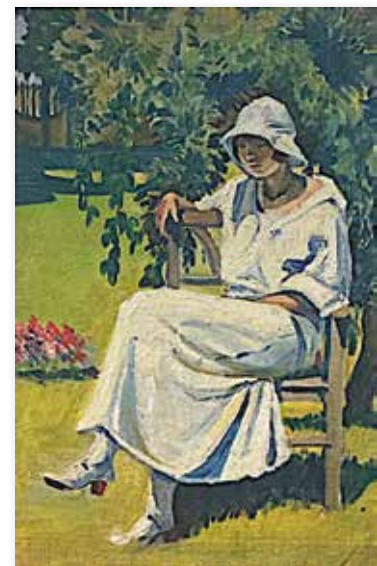
Eines der Gemälde von Margit Czobel, ausgestellt in der Slowakischen Nationalgalerie, Schloss Strážky: Sitzendes Mädchen in Weiß im Park Strážky