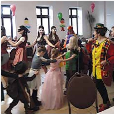
An der Polonaise beteiligten sich Groß und Klein.

Wenn sich eine Ortsgruppe auf die Jugendarbeit konzentriert, bleiben Erfolge nicht aus. Das ist zum Beispiel bei der Ortsgruppe des Karpatendeutschen Vereins in Ober-Metzenseifen/Vyšný Medzev zu sehen, deren Engagement mit drei Nachwuchstanzgruppen unterschiedlicher Altersgruppen über die Region hinaus bekannt ist. Zur Vorbereitung des diesjährigen Kinderfaschings kamen alle Mitglieder des Vorstands zusammen und berieten, wie möglichst viele Kinder und Jugendlichen angesprochen und begeistert werden können. Das Ergebnis kann sich sehen lassen.