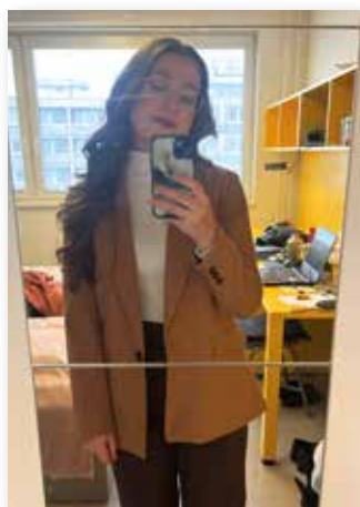
Ein morgendliches Selfie vor dem Aufbruch zum Unterricht