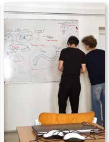
Mathematik, Informatik – und ein bisschen Kunst?