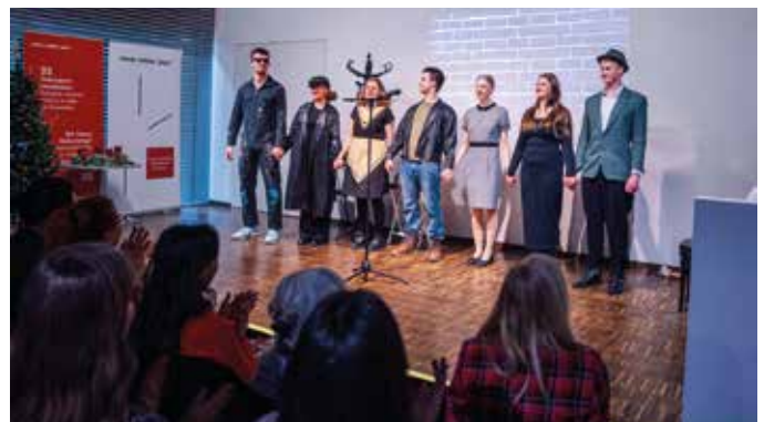
Nach der Aufführung erteten die Schauspielerinnen und Schauspieler lauten Applaus.

eines Wiener Originals. Die Studierenden wählten jene Szenen aus, die sie am lustigsten fanden und entwickelten daraus ihre eigene Inszenierung.