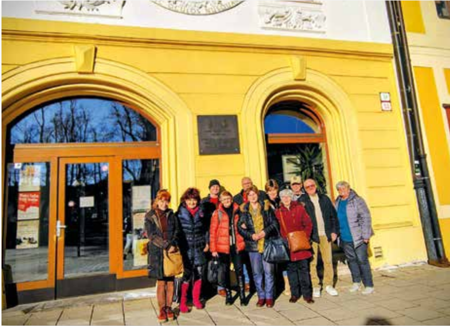
Vor dem Museum

Am 26. Februar 2026 trafen sich die Mitglieder der Ortsgemeinschaft des Karpatendeutschen Vereins aus Schmöllnitz Hütte/Smolnicka Huta in Zipser Neudorf/Spišská Nová Ves, um gemeinsam die Ausstellung des SNM-Museums der Kultur der Karpatendeutschen im Museum der Zips mit dem Titel „Tragödie der Karpatendeutschen an den Schwedenschanzen bei Prerau“ zu besuchen.