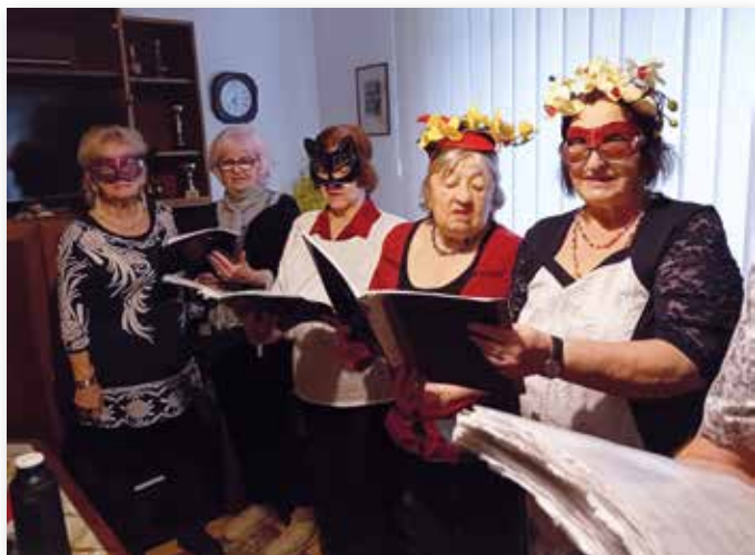
Die Teilnehmer der Faschingsfeier versammelten sich kostümiert im Klubraum in der Lichardova-Straße.