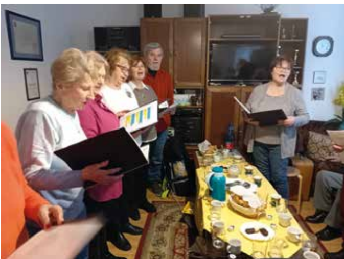
Musikalischer Beitrag: Die „Nachtigallen“ bereicherten das Programm mit drei stimmungsvollen Liedern.