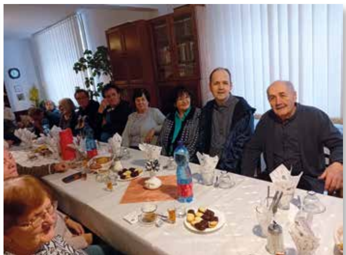
Gemütliches Beisammensein: Bei Sauerkrautsuppe und einem Gläschen Cognac wurde in fröhlicher Runde auf das neue Jahr angestoßen.