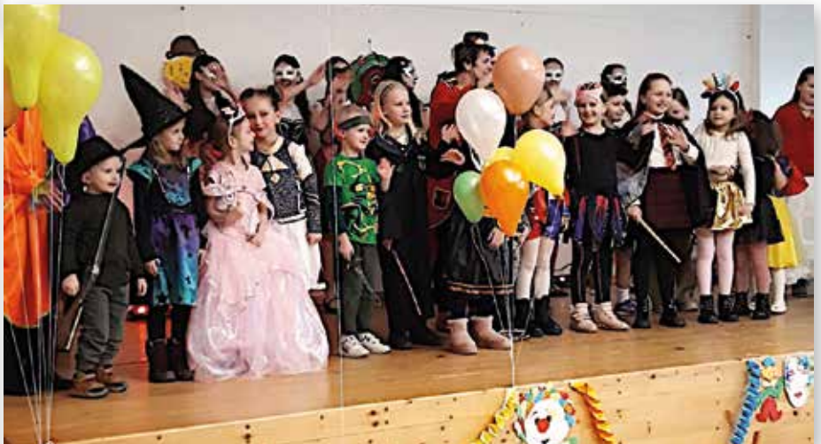
Auch auf der Bühne wurde getanzt und gesungen.