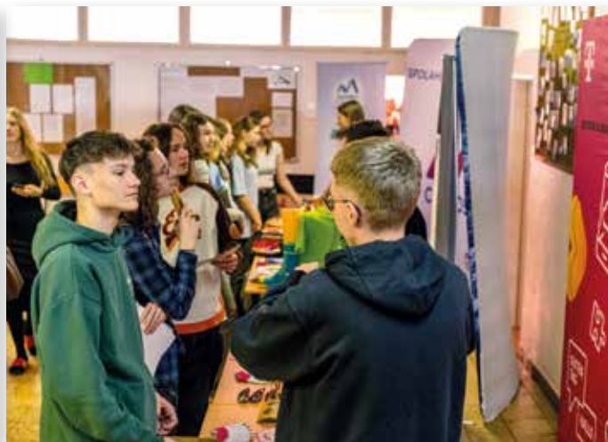
Auf der Messe sollen Schülerinnen und Schüler mit Universitäten und Unternehmen in Kontakt kommen.