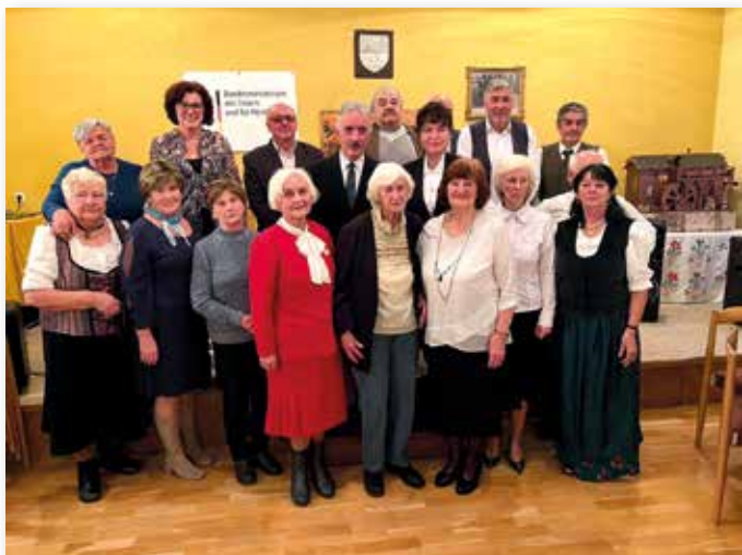
Seit 35 Jahren besteht der Karpatendeutsche Verein in der Unterzips bereits.