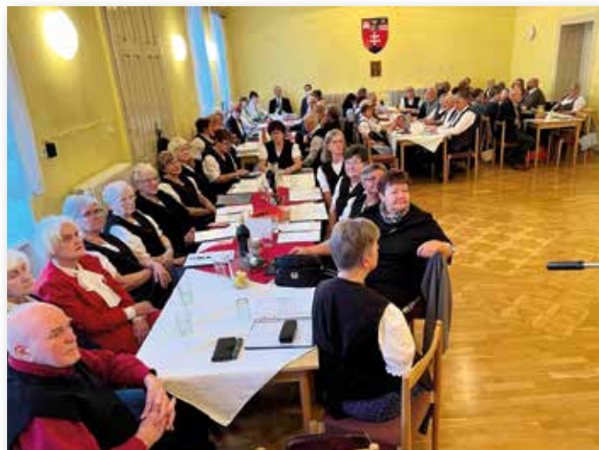
Regionale Sängerinnen und Sänger sorgten für eine feierliche und stimmungsvolle Atmosphäre.