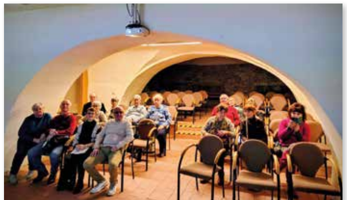
Wir erhielten eine fachkundige Führung durch die Ausstellung.