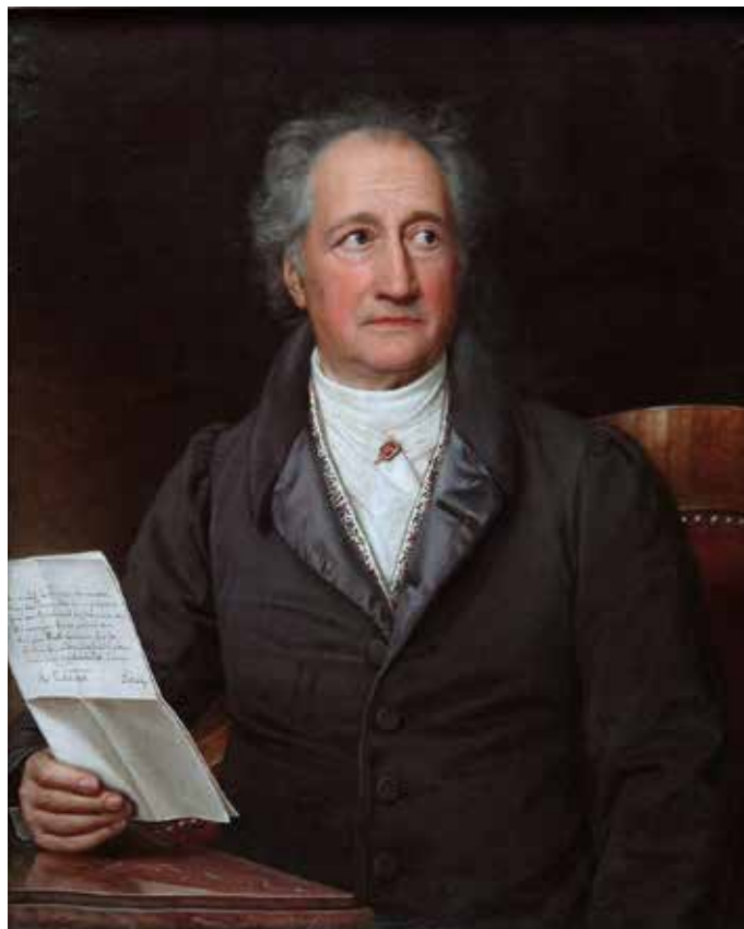
Johann Wolfgang von Goethe (1749-1832)

In der verwertungsorientierten Wissensgesellschaft dominieren Beschleunigung, Unruhe und Ungeduld. Sie behindern die Entwicklung und Bildung des Menschen. Johann Wolfgang Goethe, deutscher Dichter, Politiker und Naturforscher spricht vom langsamen Gebären der Gedanken aus dem Gegenstand selbst.