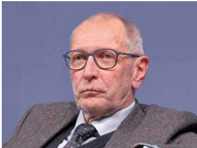
Konrad Paul Liessmann (geb. 1953)

Das „gegenständliche Denken“ bezeichnet Goethe als das reifste Denken, das die Bildung von Vorstellungen ermöglicht und zu den Anfängen, zum Aufspüren des Elementaren und Ganzen führt. Nun regieren aber offenbar Eile und Beschleunigung die Welt. Dieses Veloziferische (eine Wortschöpfung Goethes: aus dem Lateinischen velocitas = Eile, und dem Italienischen velozifero = Eilwagen oder Eilpost) wird für Goethe zum Stigma seiner Zeit, es zeigt sich nun als Stigma der Gegenwart. Doktor Faust wollte immer mehr, unterlag Mephisto und musste des Teufels Joch der Eile und Unruhe tragen.