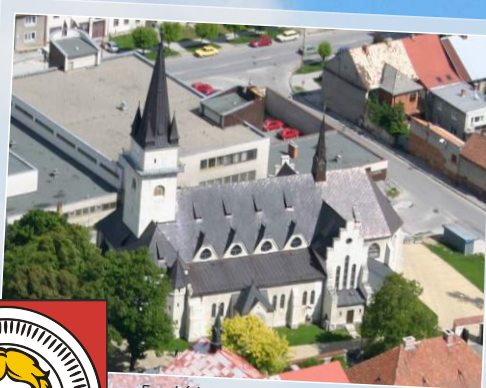
Farský kostol / Pfarrkirche