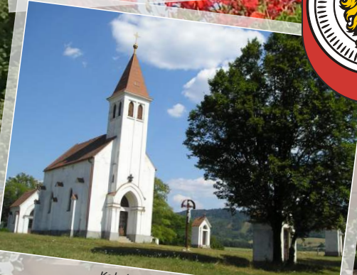
Kalvária / Kalvarienberg