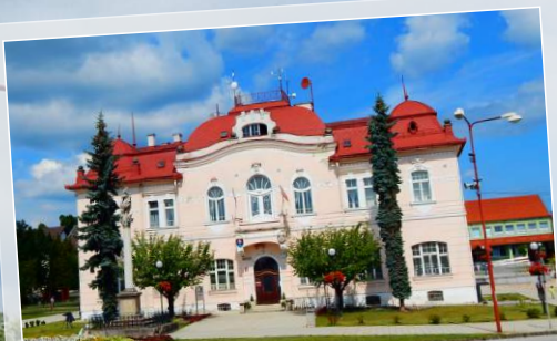
Obecný úrad / Gemeindeamt