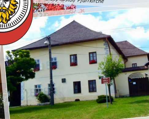
Dom stretávania KNS / Haus der Begegnung